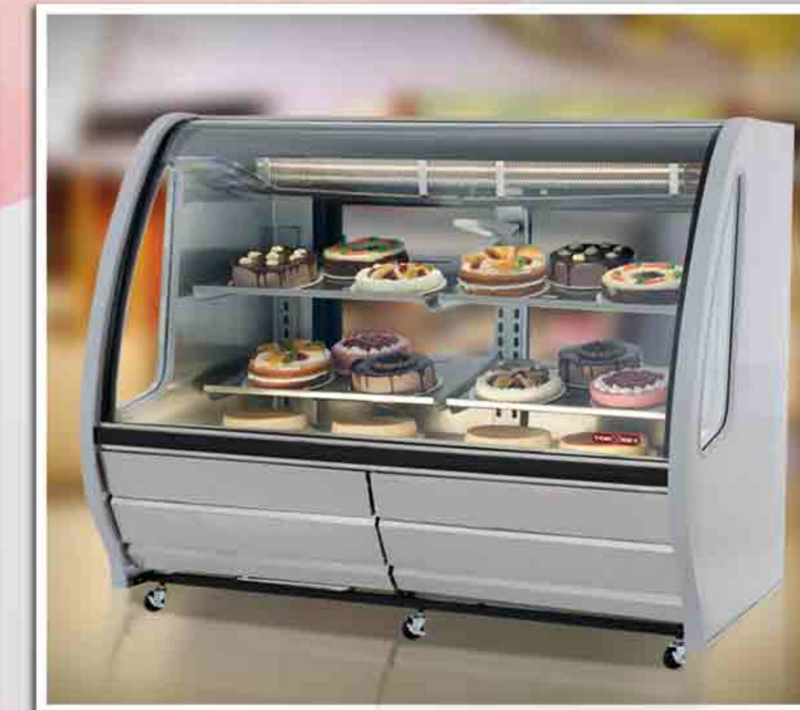
Kühlvitrinen für die Gastronomie