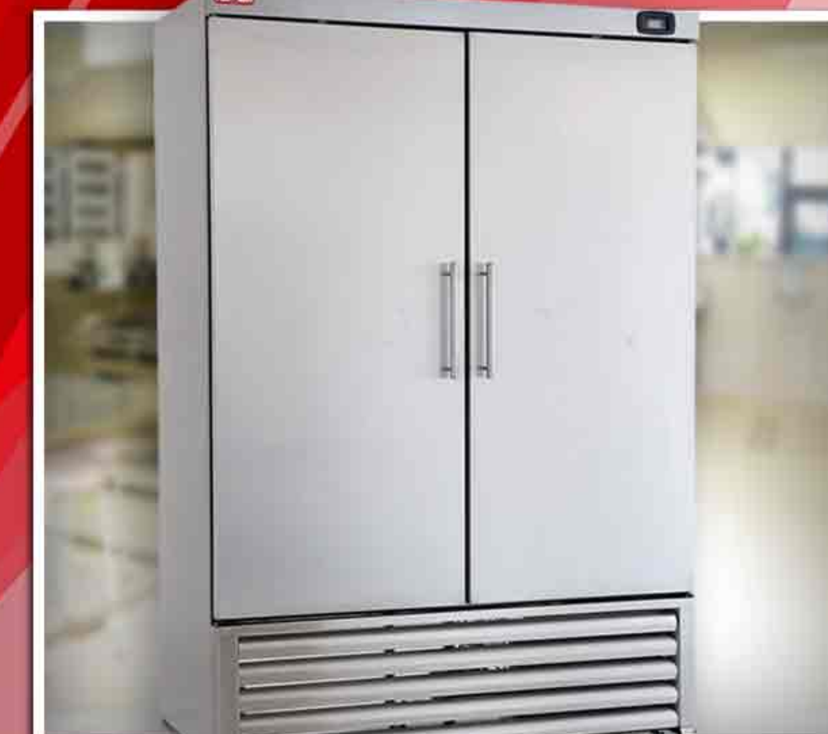
Kühl- und Gefrierschränke