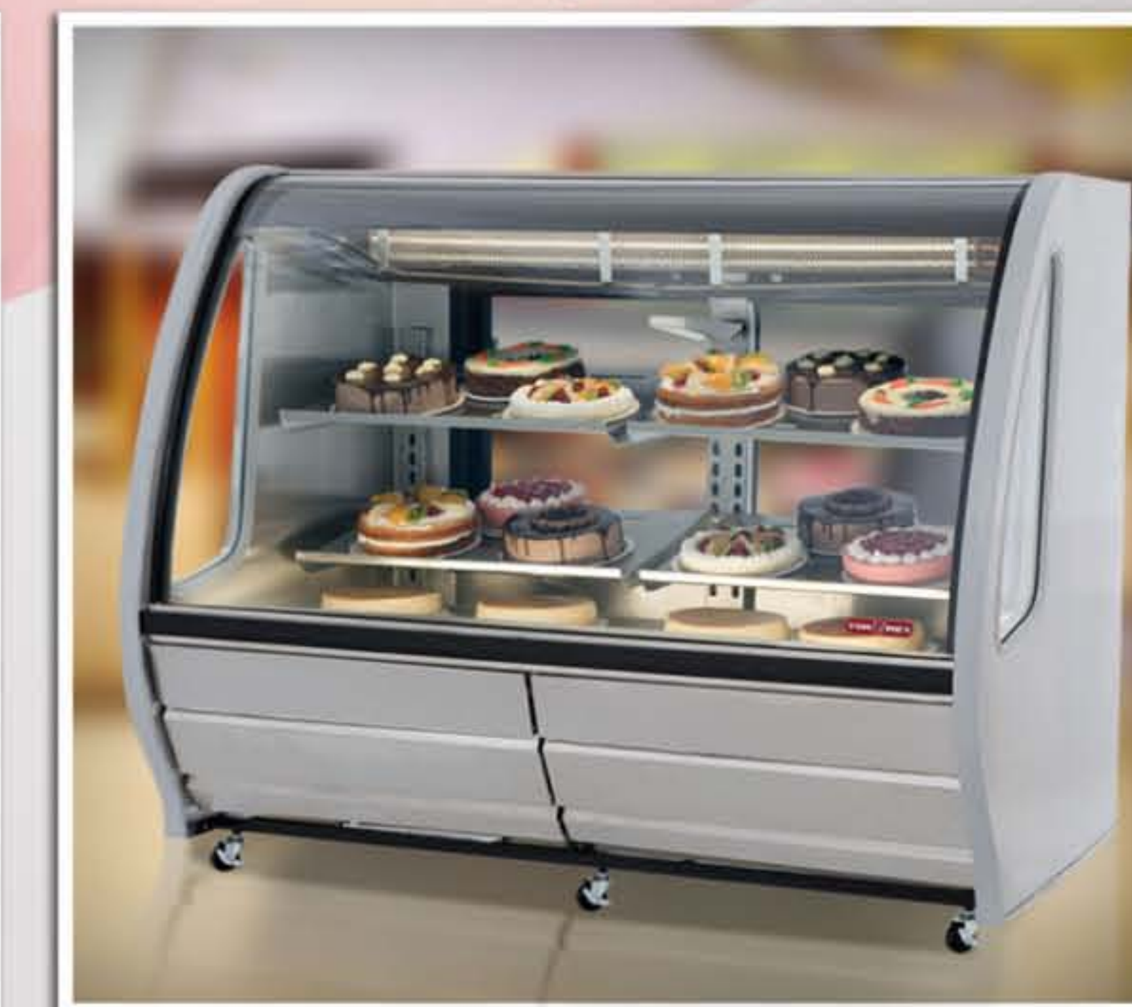
Gablota na Delikatesy