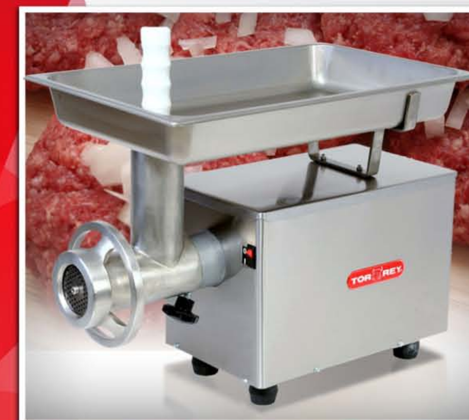
Maszyny do mielenia