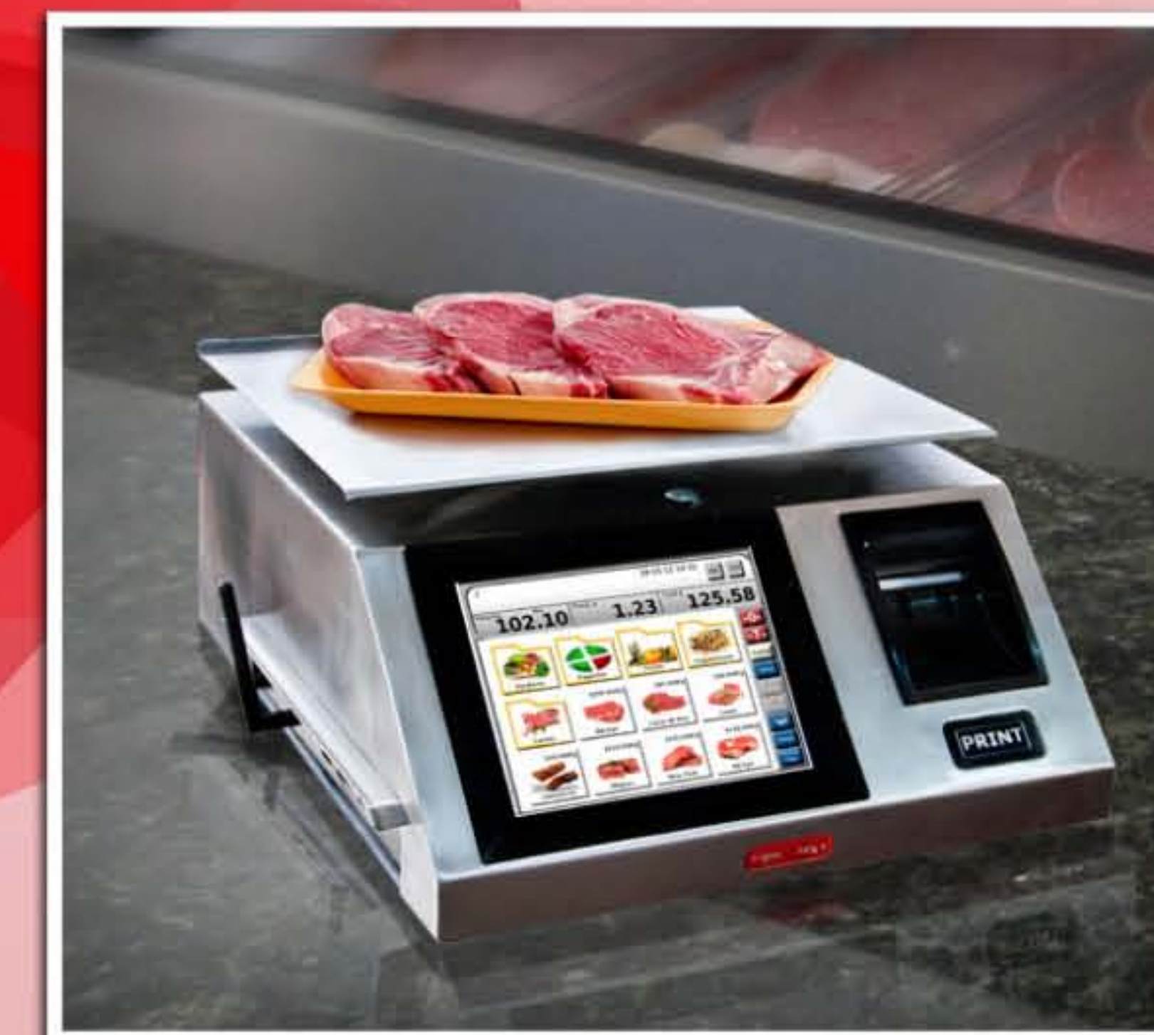
Waga z Wi-Fi