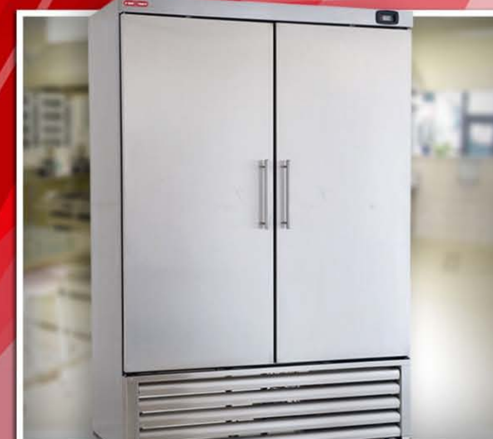
Zamrażalki i Chłodziarki